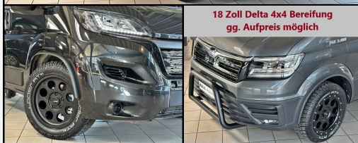
18 Zoll Delta 4x4 Bereifung gg. Aufpreis möglich