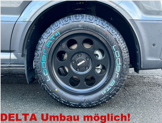
DELTA Umbau möglich!