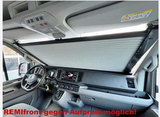
REMIfront gegen Aufpreis möglich!