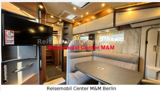
Reisemobil Center M&M Berlin