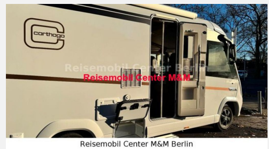
Reisemobil Center M&M Berlin