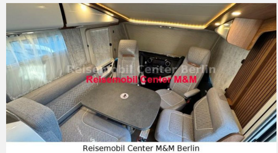
Reisemobil Center M&M Berlin