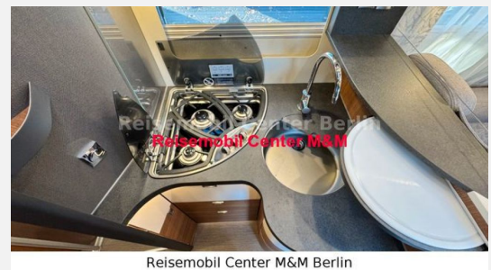
Reisemobil Center M&M Berlin